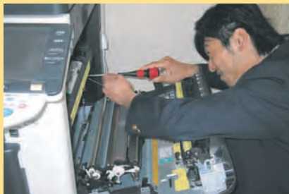
お客様との信頼関係がより強いものとなる様、迅速で 行き届いたメンテナンスサービスをこれからもご提供 致します。

迅速なメンテナンスのご対応は当然のことながら、 お客様のビジネス環境を理解し、業務改善のお役に立てる様なご提案をすること、それが エクサスのサービスです。