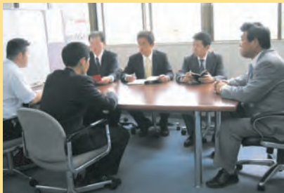
定例ミーティングは情報交換の場です。 さらなる顧客満足実現に向けて、皆が意見を出し合い、 一緒になって考えます。

お客様ごとに、ビジネススタイルやオフィスワークは様々です。 お客様のニーズや潜在的なニーズを掴み、それに応えられること、自ら考え、行動し、変化し、 新たな価値をご提案することにより、お客様満足の向上を目指します。