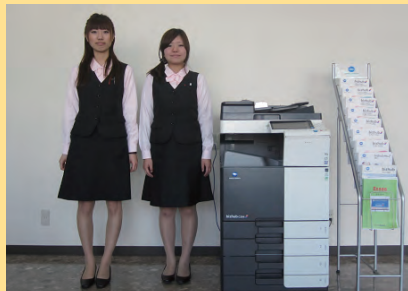
本社ショールームにて、コピー機のデモンストレーション サービスを行っています。