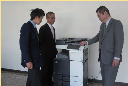
日々進化していく製品をお客様の業務改善にお役立て いただこうと、日頃から製品についての勉強を社内で 取り組んでいます。