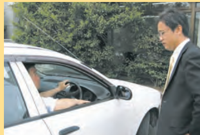
外に出れば一人ひとりがエクサスの代表者です。 製品を売るのではなく、自分自身を売り込む気持ちで、 外回りへと出掛けていきます。