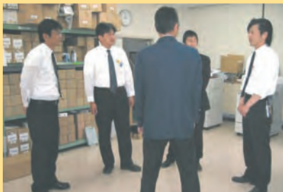
皆が集まれば、そこはサービススタッフのミーティング の場となります。お客様との約束に、迅速・的確に お応えするため、情報共有にも熱が入ります。